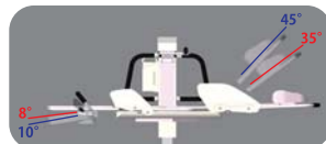
角度調整可能な背もたれ