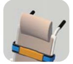
ヘッドレストCHR-10 個枠チェア用オプション

背もたれ角度固定式のチェアです。穴あき座面とフラット座面タイプをご用意しております。オプションでヘッドレストも取付可能です。(高さ調整は出来ません)