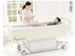
移動式スマートリフトバス「エリーゼ・ロス」