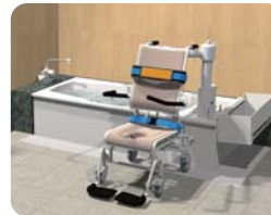
介護浴槽「個室プラス」

普段、展示会や弊社ショールームでしかご覧いただけない「個室シリーズ」や「エリーゼロス」を皆様のお勤めの施設や病院などにご訪問し、実際に見て・触れて商品のよさを体感していただけます。ぜひこの機会にお申し込みください!!