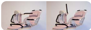
跳ね上げ式手すり

キャスターは4輪トータルロック、縦スライドのサイドレール、調整可能な背もたれ・フットガードなど、入浴者・介助者双方の立場に立った安心設計です。