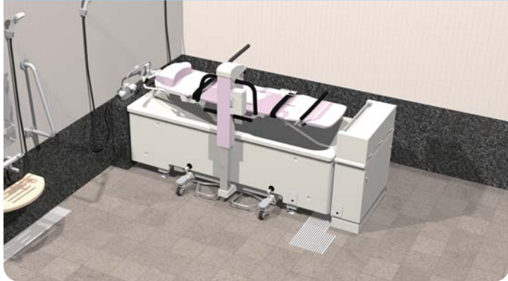
コンチェルト電動ストレッチャー

専用ストレッチャーによる寝位入浴 リクライニングは3段階設定背と膝が連動して楽な姿勢を保持