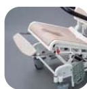
レッグサポート装備